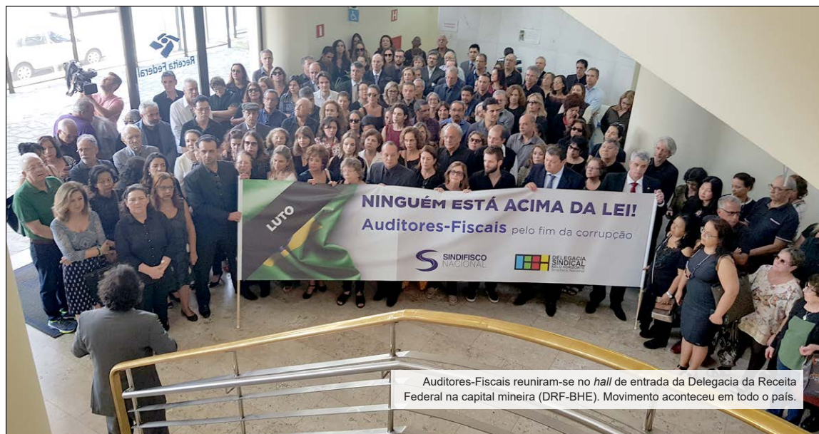
Auditores-Fiscais reuniram-se no hall de entrada da Delegacia da Receita Federal na capital mineira (DRF-BHE). Movimento aconteceu em todo o país.