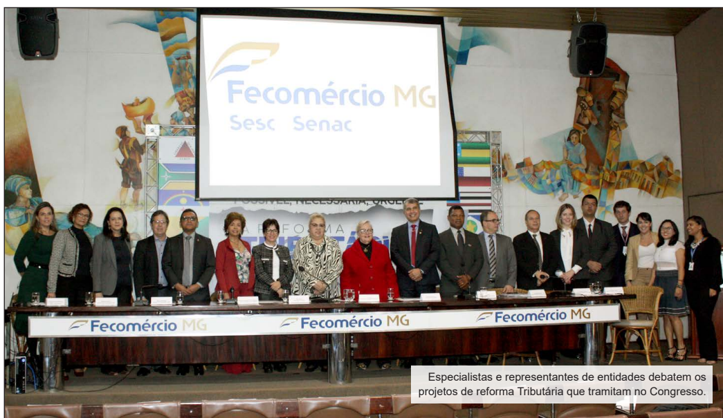
Especialistas e representantes de entidades debatem os projetos de reforma Tributária que tramitam no Congresso.