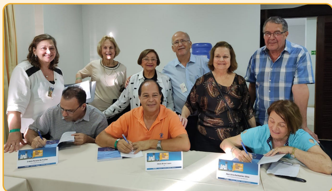
Conselheiros da ANFIP promovem divulgação e sessão de autógrafos do livro "100 Anos da Previdência Social – Coletânea", que reúne dezenas de artigos de especialistas, acadêmicos, advogados e parlamentares abordando aspectos da história e a importância do sistema de seguro social no Brasil.