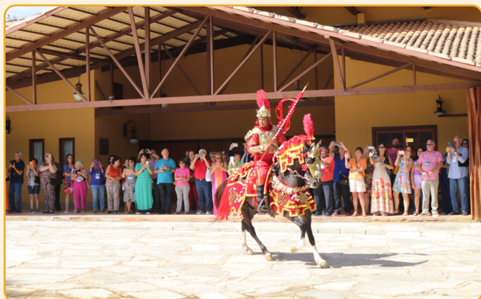
Participantes do evento se surpreendem com apresentação exclusiva das Cavalhadas, uma amostra do grande evento previsto para acontecer nos dias 28, 29 e 30 de maio, no Cavalhódromo da cidade.