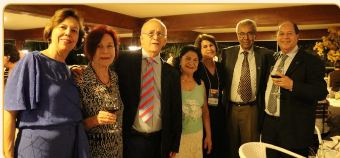
Durante o I Encontro do Centro-Oeste, conselheiros, Auditores Fiscais e convidados celebraram, em coquetel comemorativo, os 73 anos da ANFIP, completados no dia 22 de abril.