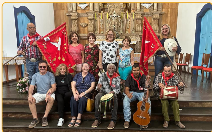
Com passeios em pontos históricos e turísticos da cidade, participantes compartilham momentos e conhecem mais sobre cultura, música e arte locais, além de contemplarem as belezas naturais no coração do cerrado brasileiro.