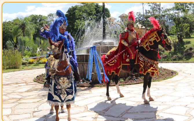
O ritual é feito há mais de 200 anos e faz parte da Festa do Divino Espírito Santo, reconhecida como Patrimônio Cultural Imaterial do Brasil pelo Instituto do Patrimônio Histórico e Artístico Nacional (Iphan).